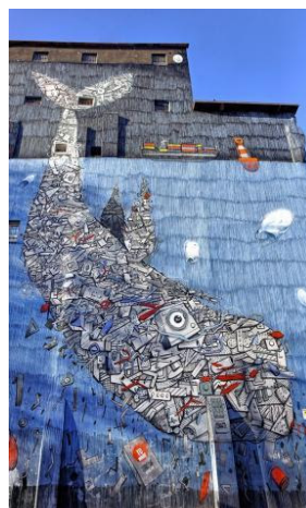
Murales visto a TO

Alla fine di tutto questo ci siamo nuovamente diretti verso la stazione per fare ritorno alle nostre case.